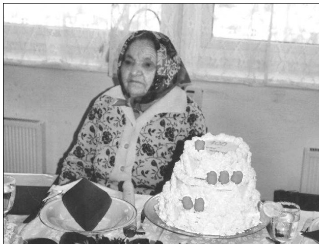
Paní Pakostové by 100 let opravdu nikdo nehádal.