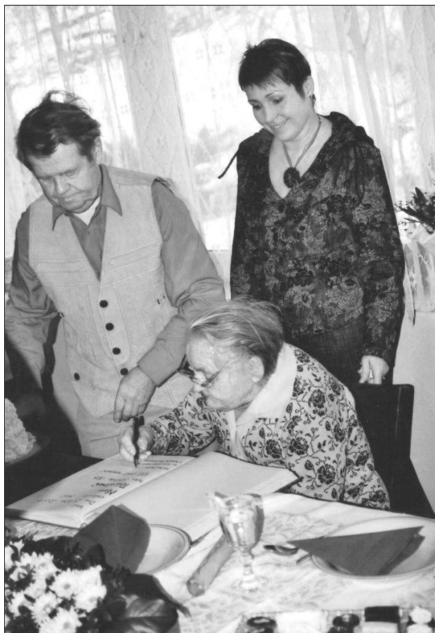
Oslavenkyně při podpisu do pamětní knihy obce.