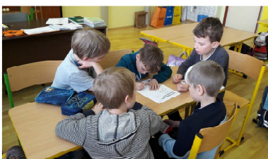
2. tř. se zamýšlí nad nepotřebnými věcmi

V pátek 6. 4. ve 2. třídě proběhlo tzv. RECYKLOHRANÍ. Vybrali jsme si téma „NEPOTŘEBNÉ VĚCI POŠLEME DÁL“. V první části jsme si povídali o konkrétních nápadech, jak zacházet s nepotřebnými věcmi. To jsme pak zaznamenávali do pracovních listů. Následně jsme zrecyklovali starý kalendář vytvořením dárkové taštičky.