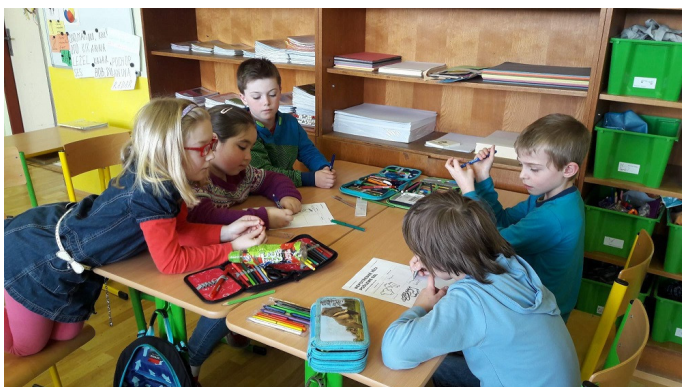
2. třída pracuje na nápadech