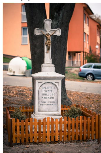
Jeden z opravených pomníků - pomník na Pohoře vedle kaple Nejsvětější Trojice

Za přispění čtyřiceti tisíci korun z Pardubického kraje a vyšším vlastním dílem se renovoval památník padlým vojákům v první světové válce na sebranickém hřbitově, dále na Pohoře vedle Kaple Nejsvětější Trojice a na Kališti. Tyto tři pomníky jsou kompletně očištěny, znovu na nich přezlacený nápis a na pomníku na hřbitově nahrazena původní popraskaná skleněná černá deska za novou s přefocenými medailony padlých vojáků. Na Pohoře a Kališti jsou obnoveny okolní plůtky i celá úprava kolem pomníků.