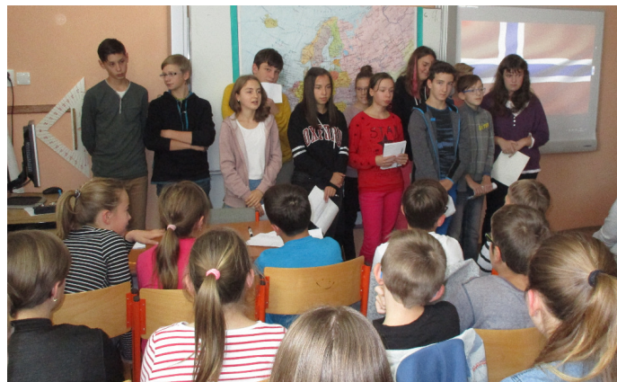
Žáci 9. třídy hovoří o Norsku

26. září bylo v roce 2001 vyhlášeno Evropským dnem jazyků. Tento den si připomínáme, jak je Evropa jazykově rozmanitá a jak důležité je učit se cizím jazykům. Vždyť kolik jazyků znáš, tolikrát jsi člověkem!