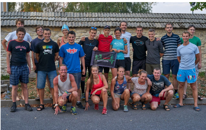
Bosco run – fotografie účastníků