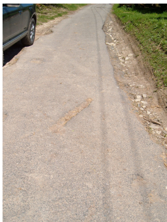
Stav komunikace před opravou