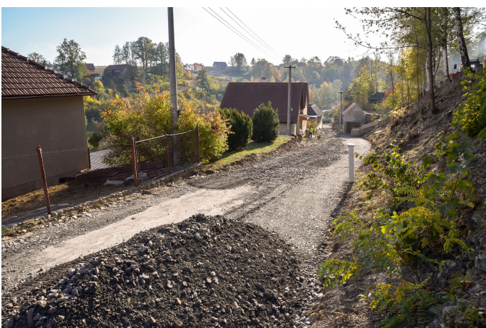
Průběh opravy