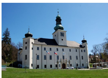
zámek v Třešti; zdroj: turustika.cz

Návštěvu Horácka zakončíme ve městě betlémů v Třešti. Ves byla založena v roce 1349 na moravsko-českém pomezí, při křižovatce obchodních cest Humpolecké a Lovětínské. Obyvatelstvo se živilo soukenictvím, výrobou sirek, hodinových skříněk a vyřezávaného nábytku. Na město byla Třešť povýšena v roce 1909. Nejstarší památkou je farní kostel sv. Martina. Zámek ze 16. století je čtyřkřídla dvoupatrová budova s nárožními věžemi, arkádami a honosným vstupním portálem. Na zámek navazuje malebný anglický park o rozloze 15 hektarů. V zámku je kongresový, hudební a společenský sál, restaurace, část je upravena na hotel. Historie tvorby třešťských betlémů, od papírových po vyřezávané, je zdokumentována v Muzeu Vysočiny. V Třešti působí aktivně Spolek přátel betlémů.