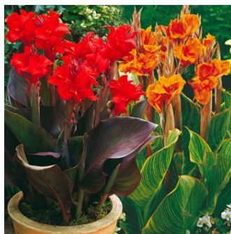
Kana, neboli dosna (lat. Canna) Zdroj: www.sieberz.cz