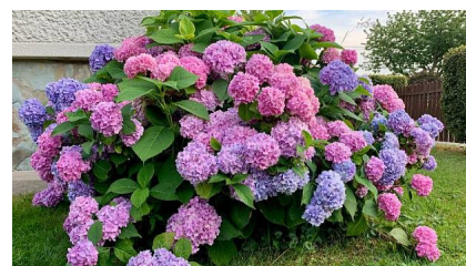
Hortenzie (lat. Hydrangea)