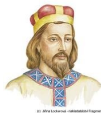
© J. J. Lohmeyer - Malbáček Fragner

Známa je Myslbekova jezdecká socha sv. Václava na Václavském náměstí v Praze, jejíž masa spočívá pouze na dvou bodech – přední levé noze a zadní pravé noze Václavova koně. Václav je symbolem české státnosti a patronem České země. Na podstavci je napsáno: „Svatý Václave, vévodo české země, kníže náš, nedej zahynouti nám ni budoucím.“