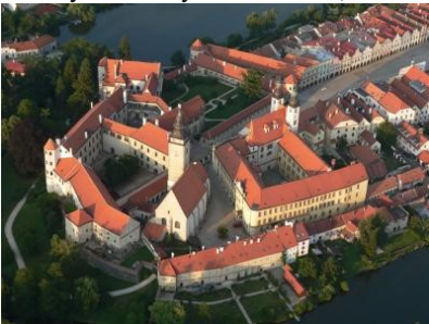
Letecký pohled na zámek v Telči

V Plně se zachovalo několik architektonicky hodnotných domů. Patří k nim dům U Rytířů s hostincem a hotelem a řadou renesančních prvků. Renesanční původ mají i domy č. 48 a 47, kde je umístěna pamětní deska připomínající pobyt Boženy Němcové. Klenbu průjezdu domu č. 48 podpírají kamenné sloupy s hlavicemi a patkami, typické pro románskou renesanci. V domě č. 28 byla od roku 1814 lékárna U Černého orla, vybavená dodnes původním zařízením. K pozoruhodným stavebním památkám patří pozůstatky židovského osídlení. Bývalé ghetto s rabínským domem, jehož průchod vede na rabínský plácek a synagoga, v níž je umístěno muzeum židovské kultury. Židovský hřbitov leží 1,5 km severně od města.