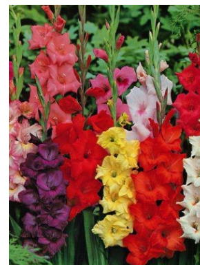
Mečíky (lat. Gladioly)