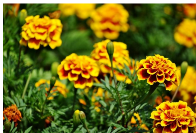
Aksamitník, lidově afrikán (lat. Tagetes)

... a v srpnu nás provázely především tyto květy: