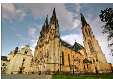
Katedrála sv. Václava