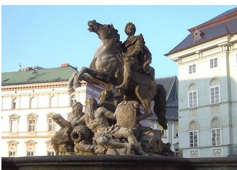
Caesarova kašna

Dolní náměstí bývalo městským tržištěm. Stojí zde kapucínský kostel Zvěstování Panny Marie. Na jižní straně je novorenesanční budova masných krámů, uprostřed barokní mariánský sloup a Jupiterova a Neptunova kašna. Horní náměstí je hlavním náměstím Olomouce. Dominuje mu renesanční budova radnice s orlojem z počátku 15. století. Caesarova kašna zobrazuje bájného zakladatele města jako jezdce na koni, dále je tu Herkulova kašna. Druhou mimořádnou dominantou Horního náměstí je sousoší Nejsvětější Trojice (projektant V. Render), je největším barokním sousoším v České republice, vysokým 35 metrů. Zároveň je jedinou olomouckou památkou, která je zapsána na listině kulturního a přírodního dědictví lidstva UNESCO. Farní chrám sv. Mořice má v interiéru naprosto unikátní varhany postavené v letech 1740–1745 vratislavským mistrem Englerem – mají více než 10000 pišťal a 6 manuálů. Poblíž kostela je Merkurova kašna.