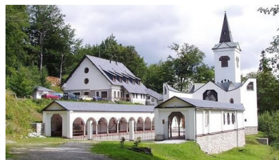
Nový poutní kostel Panny Marie Pomocné ve Zlatých Horách

V minulosti bohaté město je dnes městskou památkovou zónou s renesanční a barokní architekturou. Historickému centru dominuje dvouvěžový kostel Nanebevzetí Panny Marie s překrásnými nástrojnými malbami a kaplí sv. Josefa. Na náměstí je renesanční radnice a barokní budova staré pošty, dnes hornické muzeum. V dětské léčebně