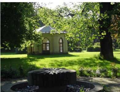
Altán v zámeckém parku v Jindřichově

Další sídlo, které navštívíme u hranic s Polskem, je Jindřichov – německy Hengersdorf byl založen v roce 1256 olomouckým biskupem Brunem z Schauenburku při osídlování Osoblažska. Po staletí patřil k panství Osoblaha a tedy k Moravě. V držení Jindřichova se pak ve 14. až 16. století vystřídalo několik místních šlechtických rodů. Mezi největší osobnosti Jindřichova patří říšský kancléř Jan Kryštof, svobodný pán z Bartensteina, který zde sídlil ve druhé polovině 18. století. Základní ranou pro obec byly události po roce 1945, kdy byla naprostá většina obyvatel odsunuta do Německa. Jindřichov se z tohoto úpadku již nikdy plně nevzpamatoval.