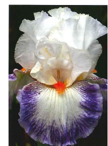
Geisha face