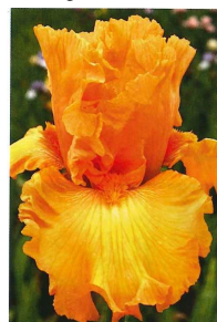
Fiery desert ocean