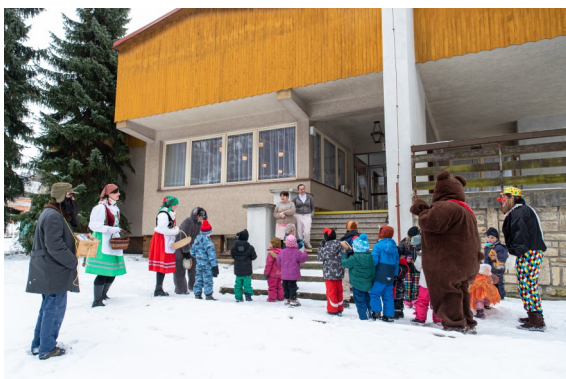
Masopustní průvod dětí z MŠ; foto: M. Čermák