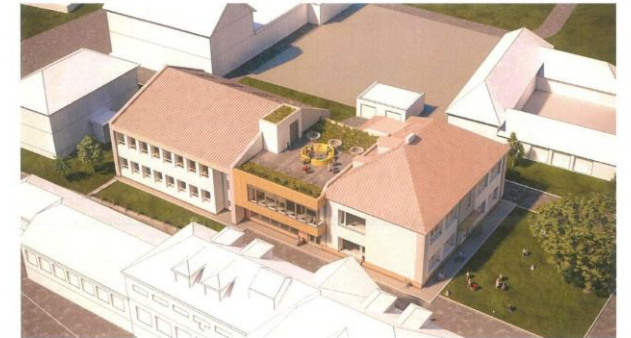
Vizualizace spojovací části komplexu ZŠ v Sebranicích s multifunkčním využitím a bezbariérovým přístupem.